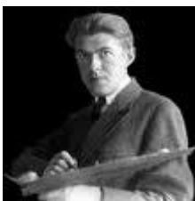
René Magritte 21/11/1898