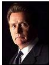
Martin Sheen 3/8/1940