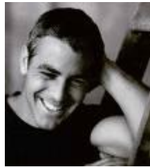
George Clooney 6/5/1961