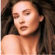
Demi Moore 11/11/1962