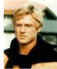
Robert Redford 18/8/1936