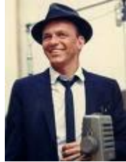
Frank Sinatra 12/12/1915