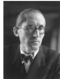
Le Corbusier 6/10/1887