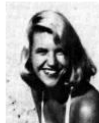
Sylvia Plath 27/10/1932