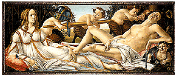
Venus y Marte - Botticelli

Marte son los instintos, las pasiones y el impulso sexual. Pueden salir reacciones de eventos pasados. Hay que saber manejar estas situaciones para no obsesionarse o alterarse demasiado.