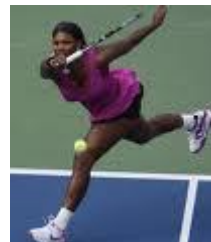
Serena Williams 26/9/1981