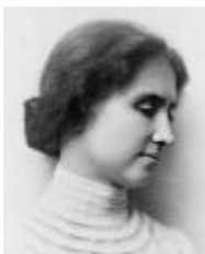
Helen Keller 27/6/1880