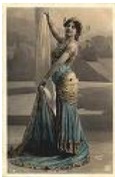
Mata Hari 7/8/1876