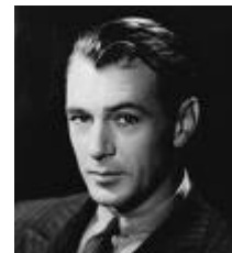
Gary Cooper 7/5/1901