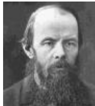
Feodor Mikhailovich Dostoevski 11/11/1821