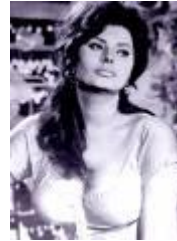
Sofia Loren 20/9/1934