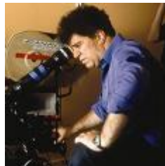
Pedro Almodovar 24/9/1951