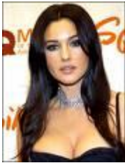
Monica Bellucci 30/9/1964